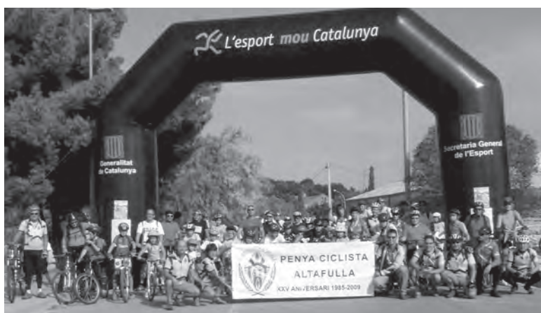
Foto família de la Peña Ciclista d'Altafulla en la pedalada popular

Aquest mes la celebració del nostre XXV aniversari ha consistit en l'organització d'una pedalada popular. Va ser el dissabte 3 d'octubre. Un dia de sol que acompanya a tots els participants. Més de 140 inscrits, de totes les edats, van fer dos recorreguts; el curt, pels carrers propers al castell per als més petits, i un recorregut per tot el poble, des del castell fins a la platja per als altres. Durant tot el recorregut la guàrdia urbana va ordenar el trànsit, permetent així el pas dels ciclistes amb seguretat. Moltes gràcies. Al final, es van repartir obsequis entre tots els participants, unes gorres commemoratives, refrescos i alguna cosa per a picar, tot amenitzat per una banda de música que va moure a més d'un a donar uns passos de ball. El diumenge 4, la sortida habitual es va canviar per la celebració anual de la trobada de penyes ciclistes del Baix Gaià. Aquest any, l'organització corria a càrrec dels companys de la Pobla de Montornès. Juntament amb socis del CC Torredembarra i del CC La Riera de Gaià varem fer un recorregut ciclista i després un esmorzar de germanor a la Pobla. •