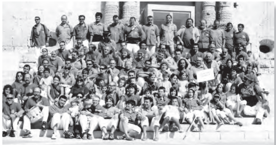
Colla dels Castellers d'Altafulla en el Concurs de Torredembarra.

força. Se li poden atribuir diversos qualificatius; el més normal és catalogar-la com a increïble, magistral i històrica. I és que els Castellers d'Altafulla, van recuperar les fites de la primera etapa de la colla. Van descarregar un dos de sis, un tres de set, un quatre de set i un pilar de cinc. Tot plegat: un repertori carregat d'emoció èpica, els vint anys d'un pilar de vuit immòbil, la Festa Major petita, una ermita plena de veïns... ha fet que les nostres camises executessin amb una seguretat impecable i ritme compassat l'art de fer castells.