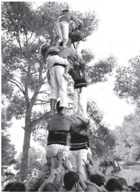
Dos de sis dels castellers a Sant Antoni. / Dennis Trendtel

Serà l'alegria del vintè aniversari de l'escultura, la força que transmet el conjunt arquitectònic, tot o no res, qui sap. El que és ben cert és que la passada Diada de Sant Antoni d'enguany ha destacat, i