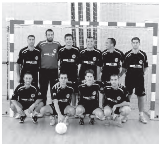
Nova indumentària del primer equip. / Esther Pagès

El Club Futbol Sala Altafulla ha estat treballant aquests darrers mesos en la creació de la pàgina web de l'entitat i està previst que s'estreni durant aquest mes de novembre. D'altra banda, el primer equip, que milita en la Territorial Catalana, ha estrenat aquesta temporada nou vestuari. Una indumentària que, de moment, els ha dut sort, ja que han guanyat els tres primers partits de la competició (3 a 5 contra el Montsant FS, 3 a 7 davant el CFS L'Aldea A i 6 a 2 davant el Berga FS), uns resultats molt positius ja que, des del seu ascens a la Territorial Catalana, mai havien aconseguit encadenar dues victòries consecutives fora de casa en el primer tram de la competició. Per la seva banda, el segon equip, que milita en la Primera Divisió Territorial també va sumar victòria en la primera jornada, 4 a 3 davant el Gandesa FS A, mentre que les fèmies, en la Primera Divisió Femenina, van sumar un empat a 2 davant el Despertaferro FS A, una victòria contundent de 15 a 1 davant el Móra d'Ebre FS A i una altra golejada de 6 a 1 davant el CFS Salou A. A més, l'Escola d'Aprenentatge del CFS Altafulla ha dut a terme tres trobades esportives aquest passat mes d'octubre durant tots els dissabtes amb un gran èxit de participació assolint així la xifra de 70 joves inscrits i ha organitzat diferents partits amistosos. Un inici rodó pel CFS Altafulla que ha vist també com en aquesta temporada s'estrenava el gimnàs del pavelló poliesportiu. •